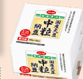
CO-OP 国産大豆 中粒納豆