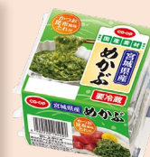
CO-OP 宮城県産めかぶ (たれ付)