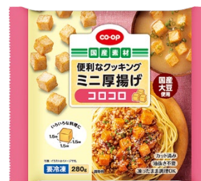
便利なクッキング ミニ厚揚げ コロコロ

たとえば、夏に登場頻度の高い麺類には、調理不要でパッと足せるたんぱく源を選んで、つけ汁やトッピングに追加してみましょ。冷たい麺は胃や腸の負担になることもあるので、具たくさん温かいつけ汁に変えるのも◎。