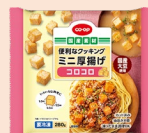
CO-OP 便利な クッキング ミニ厚揚げ コロコロ