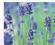
ラベンダー油、 フランスラベンダーエキス