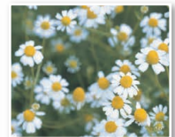
ローマカミツレ花油