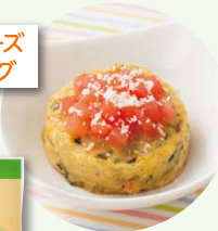
トマトチーズハンバーグ

声 1歳半の息子の大好きで、すごく食べてくれます。野菜の事とかいろいろ考えないし…と、思いながら、仕事してるのでなかなか…。このハンバーグなら野菜やひじきなど入ってるので、仕事をしているママさんの強い味方です!! 常に冷凍庫に入れていたぐらいです。