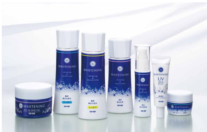
※美白とはメラニンの生成を抑え、シミ・ソバカスを防ぐことです。