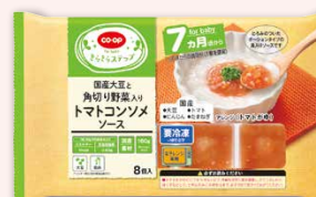
たらのソテー トマトソース