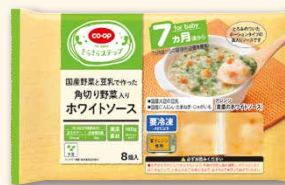
青菜のホワイトソース