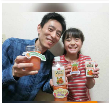
まくちゃさん(神奈川県)

親子で主に朝食時に飲んでいます。パッケージは何種類かあるので子どもは選ぶ楽しみがあり、飲み終わった後のじゃんけん、おみくじも楽しんでいます。