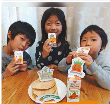
まっすんさん(兵庫県)

このキャンペーンでは、画像を投稿すると当選確率がアップする 「フォトコンテスト」企画も開催! 素敵な画像が多数寄せられました。 その一部をご紹介します!