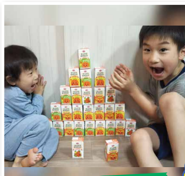
まりっぺさん(大阪府)

兄妹でミックスキャロットが大好き。兄は冷やして、妹は冷やさないのがお気に入り。お風呂上がりにパジャマでミックスキャロット!!