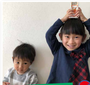
ひろみさん(広島県)

ポーズしてと言ったら、お姉ちゃんが自分で考えてポーズしてくれました。二人とも、渡したら一瞬で飲み干してしまうほど大好きなジュースです。