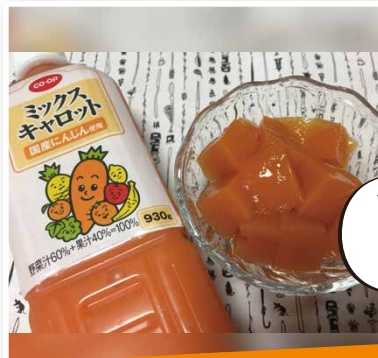
ミッキャロ大好きさん(福井県)