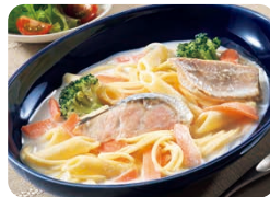
クリームスパゲッティ