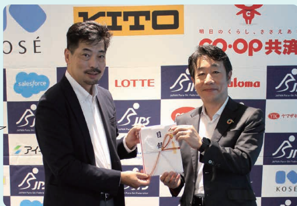
※撮影時のみマスクを外しています