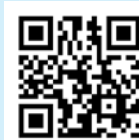
商品検査センターのホームページ