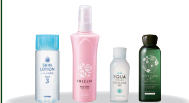
コープ化粧品シリーズ全品

この他、カタログ「くらしと生協」ではブラジャー全品を対象に通年でキャンペーンを行っています