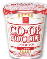
コープヌードルシリーズ