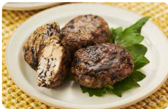
いつもの メニューに 豆類をプラス