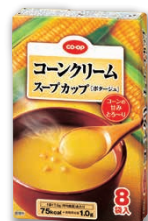
カップスープシリーズ