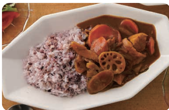
毎日のお米に 雑穀や 押麦などを