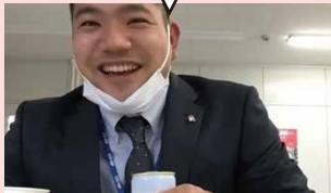
コープあいち 職員

大人はこっちが好き？ さらっとしていて野菜ジュースという感じ。でもバナナが無いとちょっと寂しい。