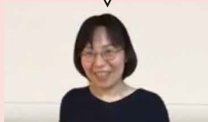
コープしが 組合員理事さん