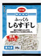
CO-OP ふっくら しらす干し を使ったレシピです