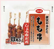
CO-OP 炭火やきとり もも串 (しょうゆだれ) を使ったレシピです