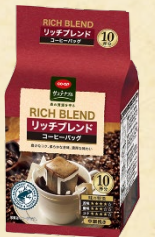
CO-OP コーヒーバッグ リッチブレンド