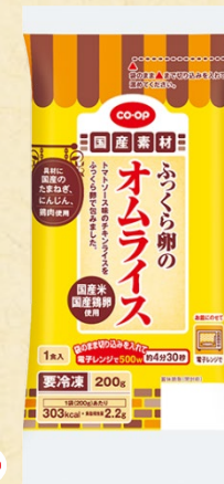
CO-OP ふっくら卵のオムライス