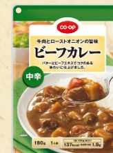
CO-OP ビーフカレー 中辛