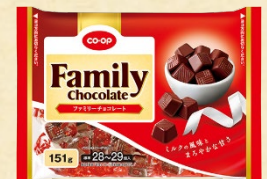
CO-OP ファミリーチョコレート