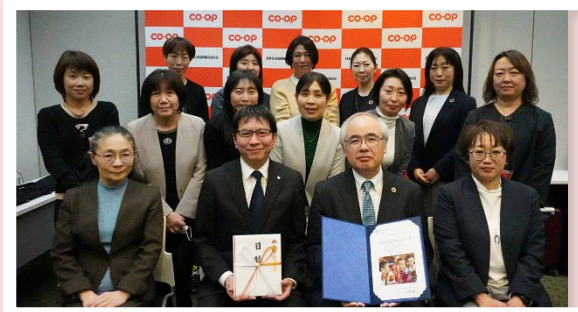
▲参加された組合員商品委員会の皆さんと